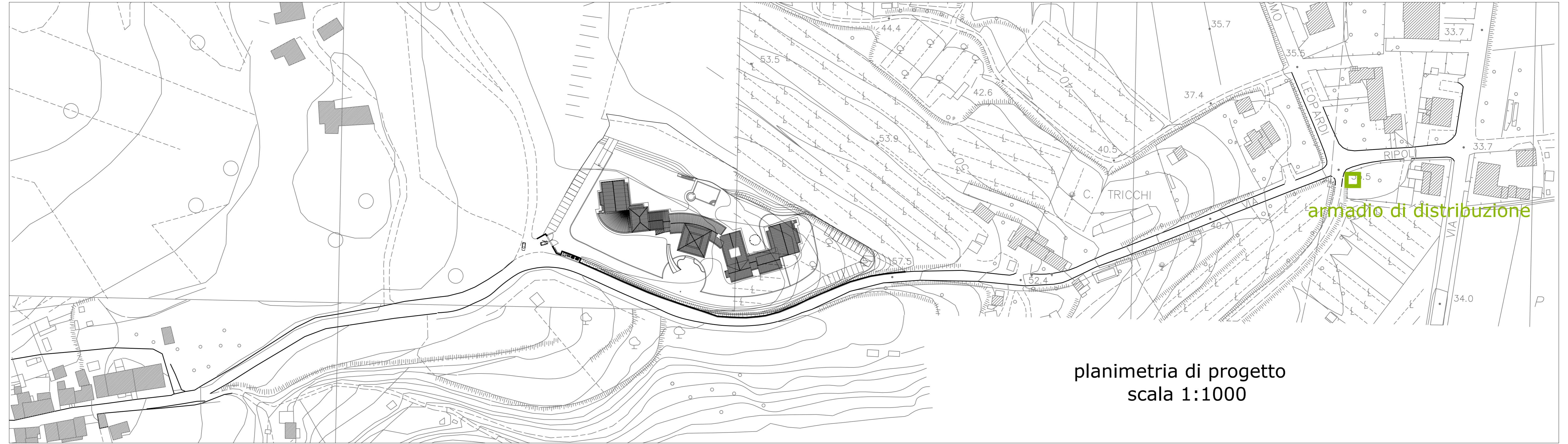
planimetria di progetto scala 1:1000