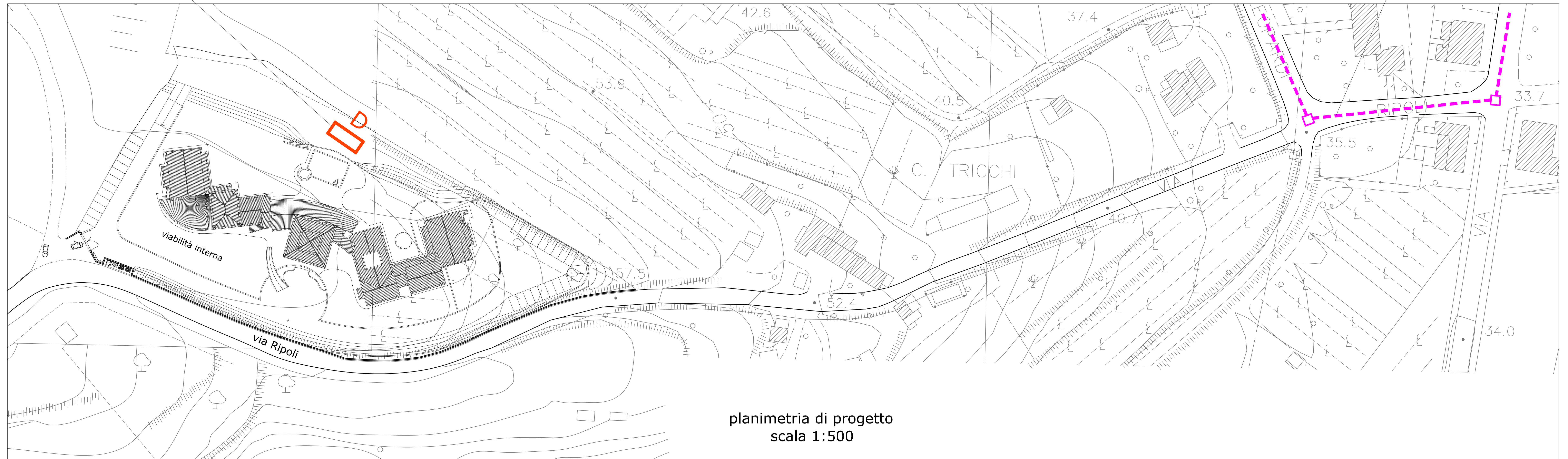
planimetria di progetto scala 1:500