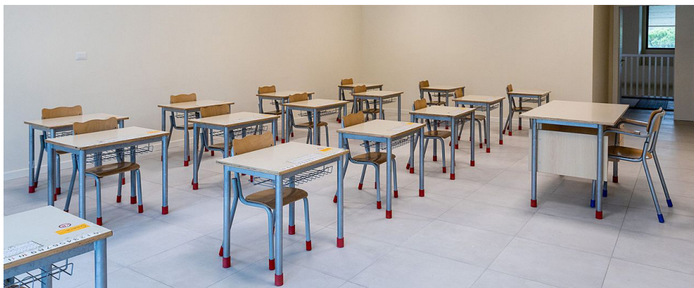
Scuola: corridoio principale della Scuola Primaria Lidamo Ciurli