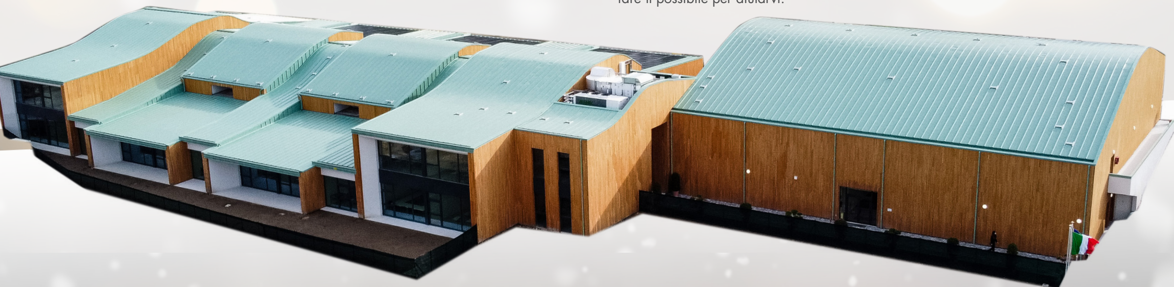
IMMAGINE DEL NUOVO POLO SCOLASTICO

Dedico un pensiero particolare a chi sta subendo i morsi della crisi economica che questo periodo comporta: chi si trova in cassa integrazione, chi ha un'attività economica colpita dai vari provvedimenti di chiusura che si sono susseguiti e ancora non adeguatamente indennizzata. Siamo al vostro fianco e stiamo cercando di fare il possibile per aiutarvi.