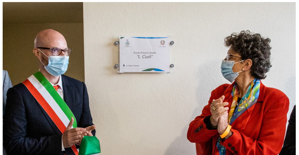
Scuola: corridoio principale della Scuola Secondaria di Primo Grado Torquato Cardelli