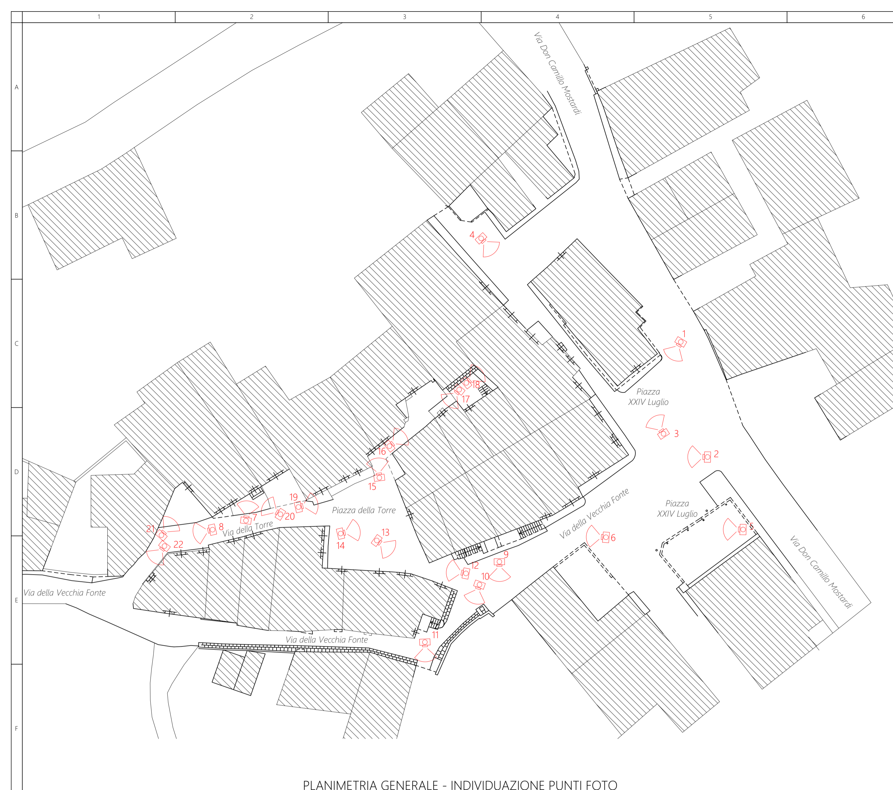
PLANIMETRIA GENERALE - INDIVIDUAZIONE PUNTI FOTO