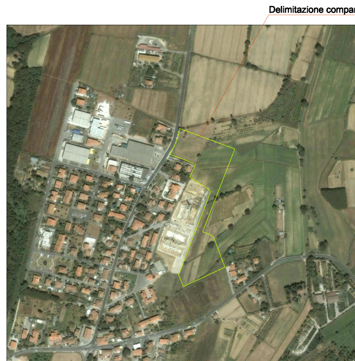
VISTA AEREA scala 1:5000